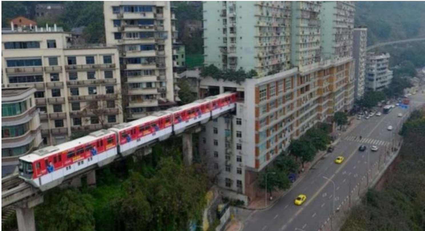
Chongqing hat eine besondere Verkehrsplanung