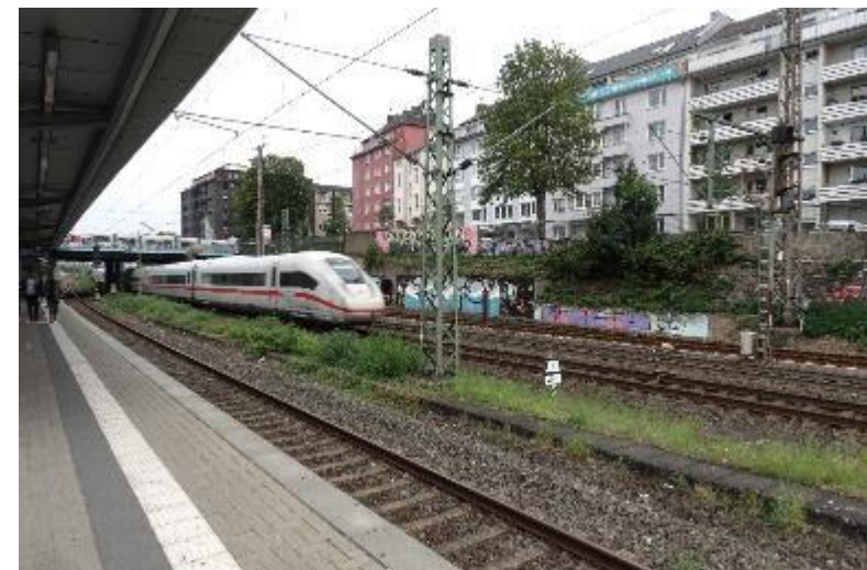
Düsseldorf, S-Bahnhof Wehrhahn

Die Auslobenden räumen sich das Recht ein, weitere nicht stimmberechtigte Sachverständige hinzuziehen.