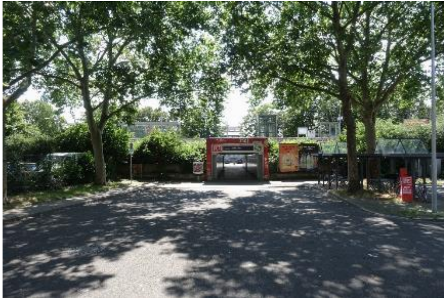
Düsseldorf, S-Bahnhaltestelle Eller Süd