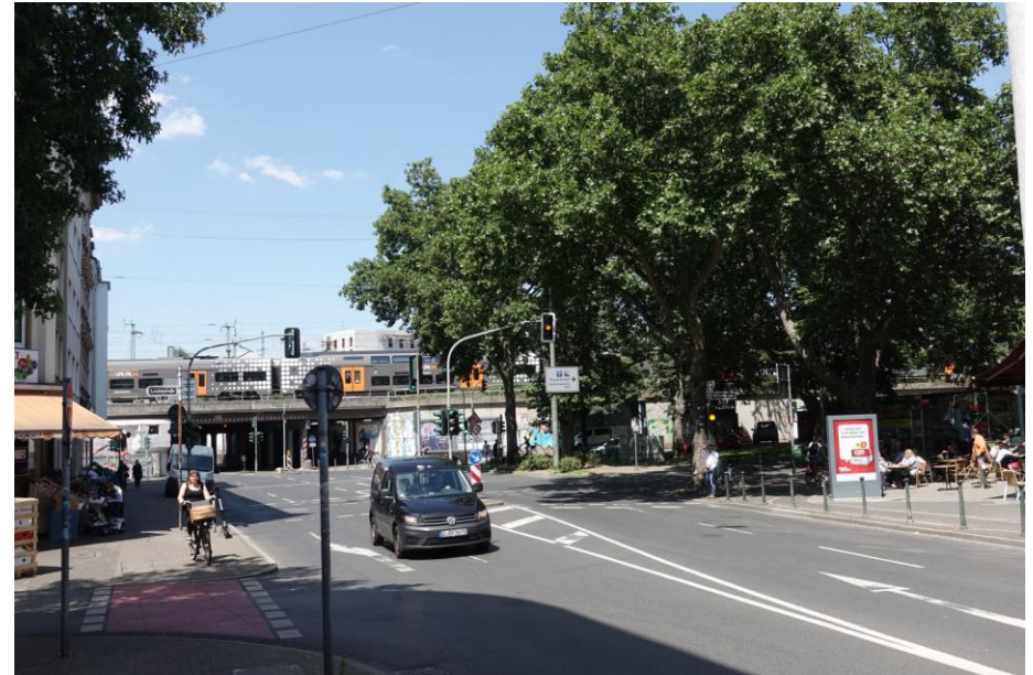
Düsseldorf, Überführung Ellerstraße

Die Ausloberinnen behalten sich vor, weitere Personen für das Auswahlgremium zu benennen.